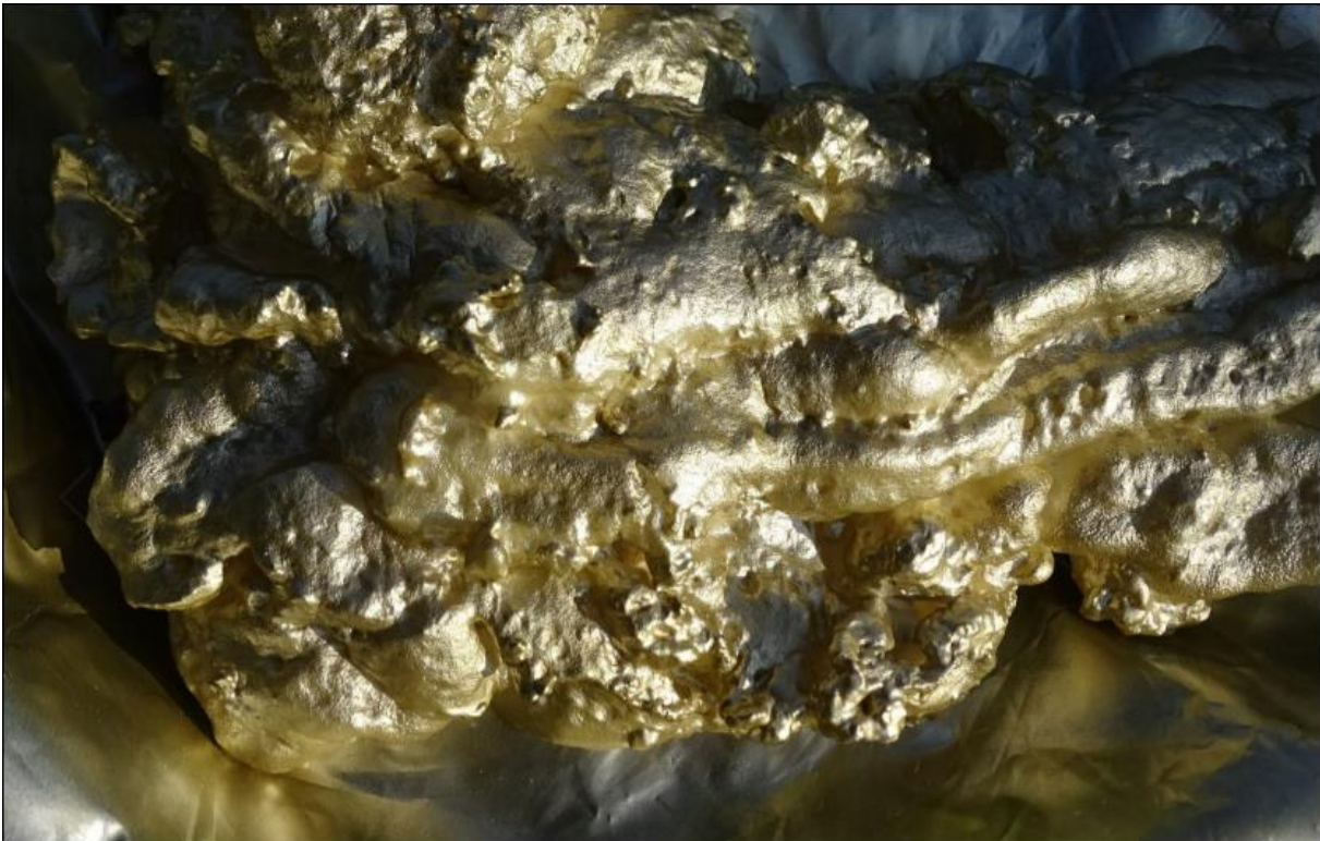
Wie weet wat dit is krijgt een ontbijt op bed.